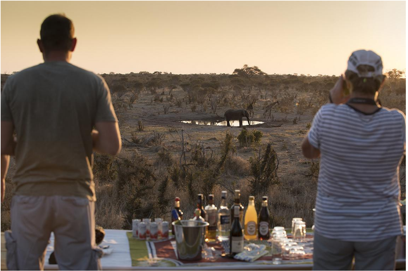
Okavango Delta – Tuludi