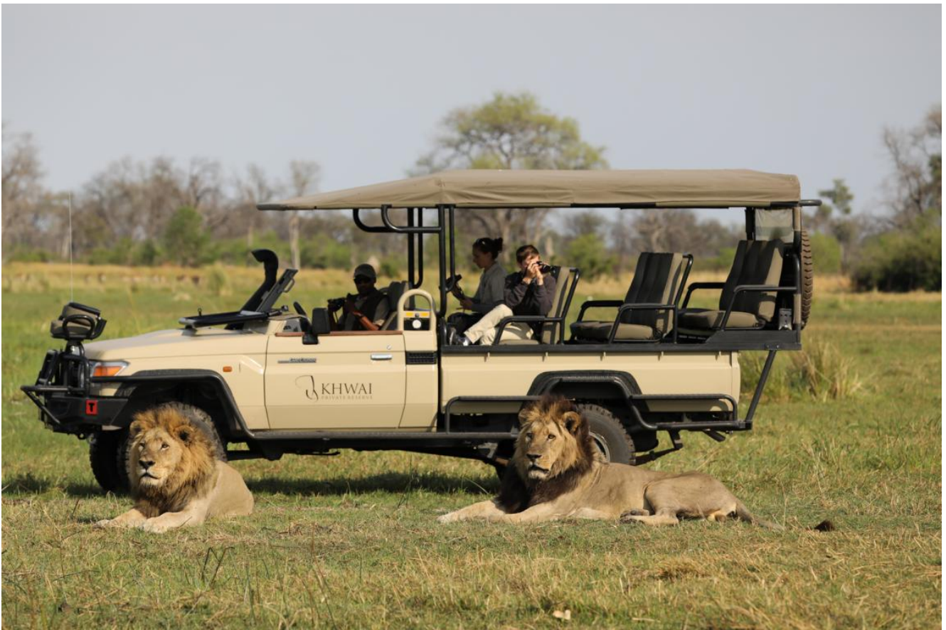
Okavango Delta – Little Sable