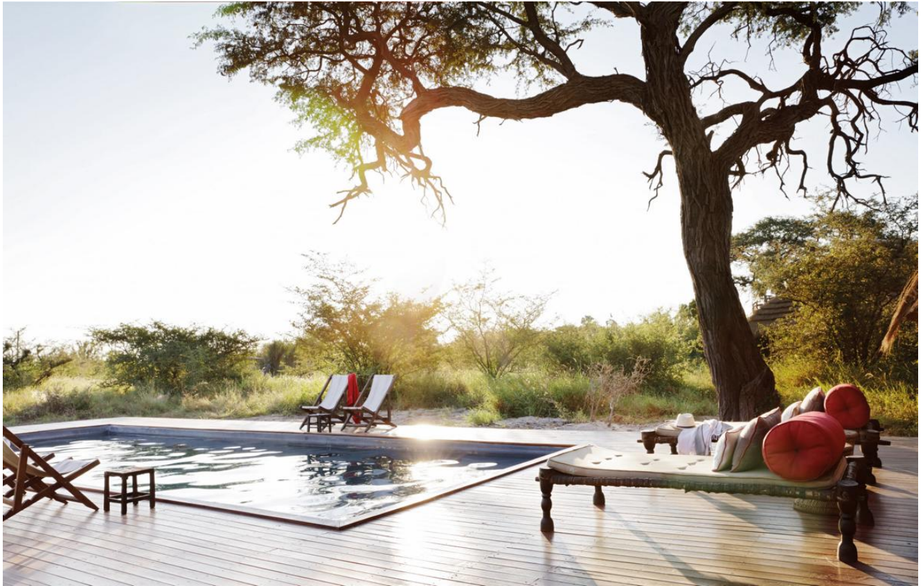
Makgadikgadi Pans – Jack's Camp