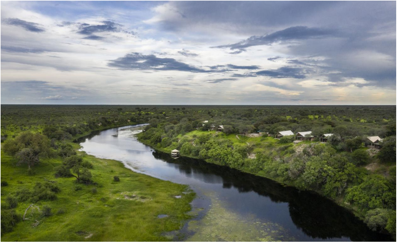
Makgadikgadi – Planet Boabab