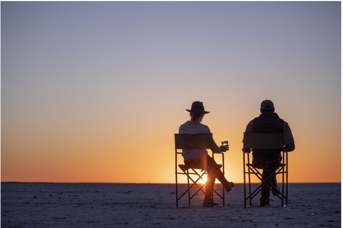
Makgadikgadi Pans – San Camp