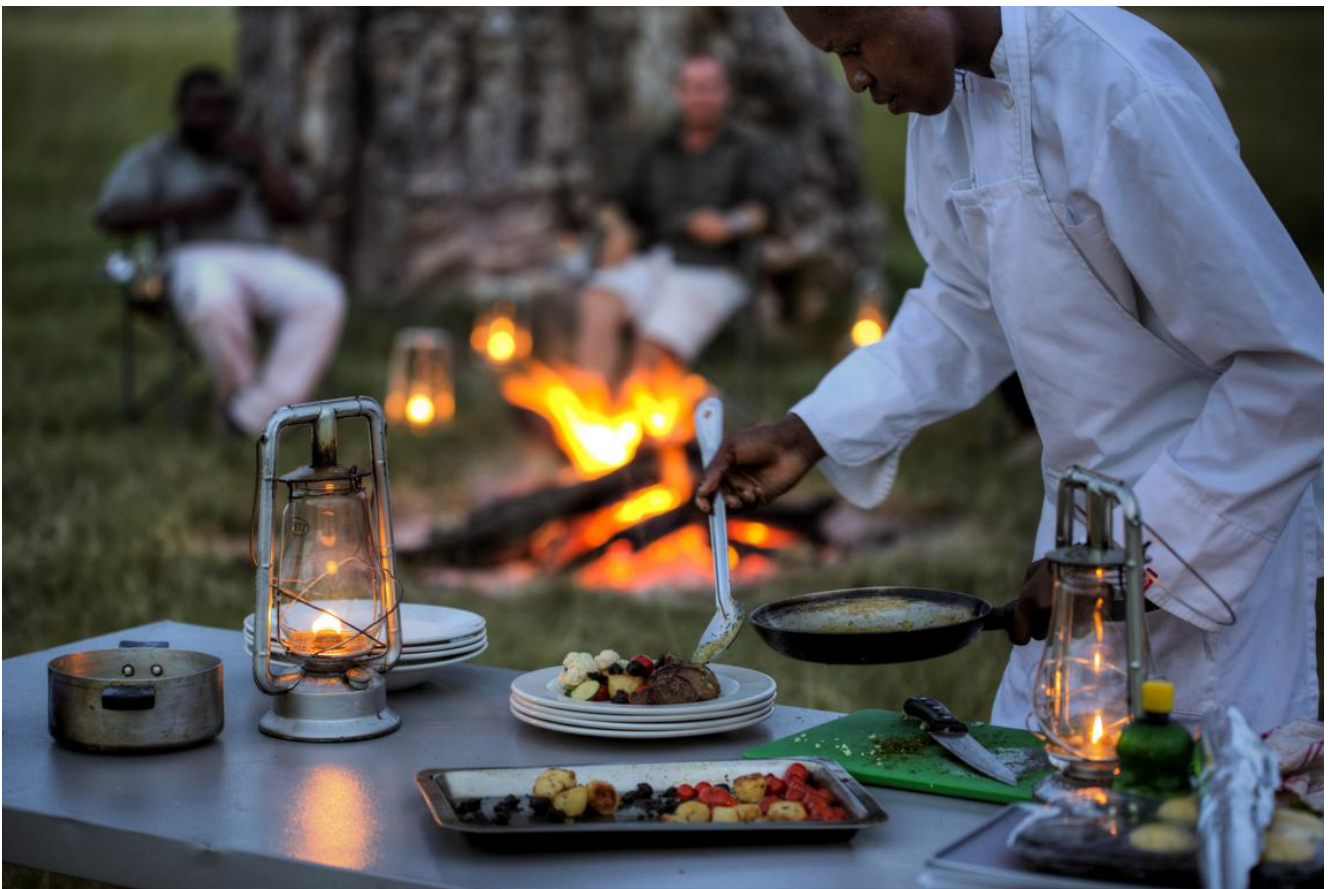
Okavango Delta – Mobile Expeditions