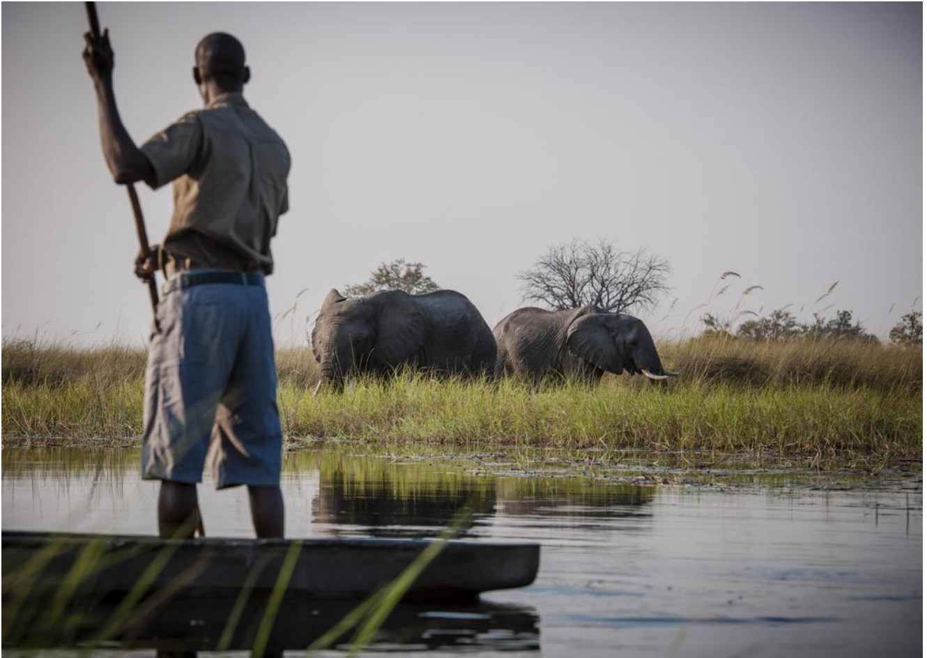
Okavango Delta – Hyena Pan