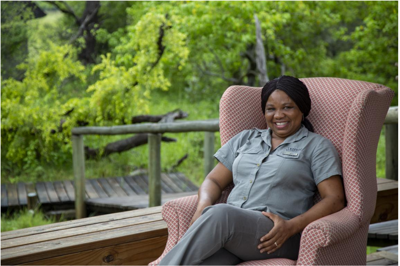
Okavango Delta – Mapula Lodge