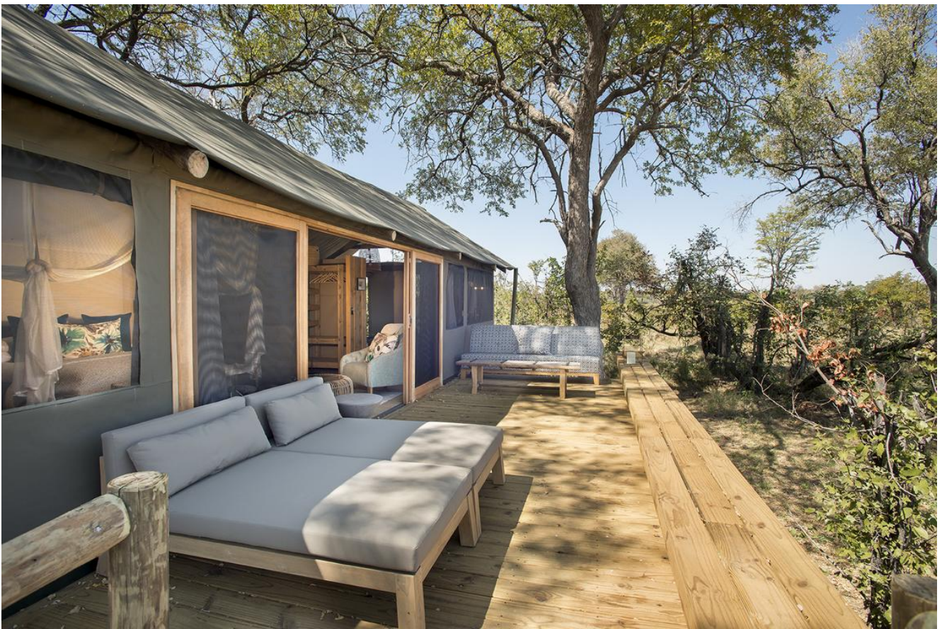
Okavango Delta – Skybeds