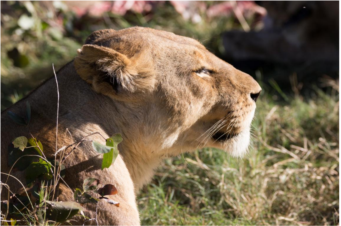
Okavango Delta – Sable Alley