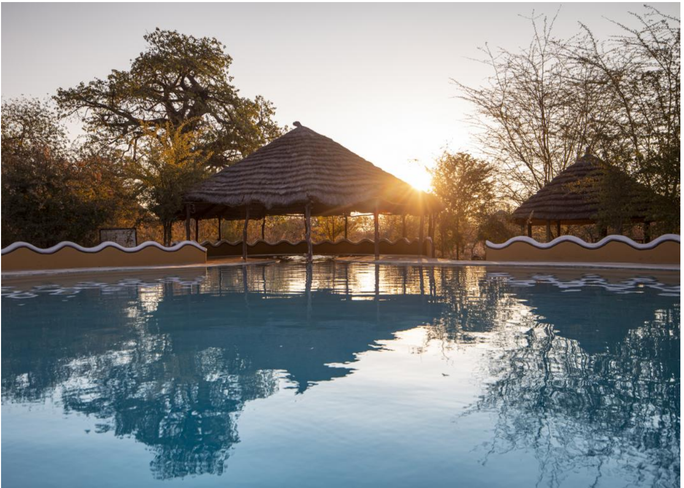
Makgadikgadi Pans – Camp Kalahari